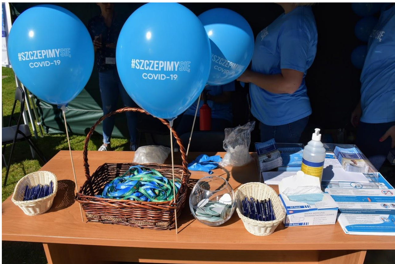
Akcja informacyjno - promocyjna dot. szczepień przeciwko Covid 19.

Wynikiem prowadzonych działań było zajęcie przez Gminę Pionki 2 miejsca spośród gmin Powiatu Radomskiego w konkursie „Rosnąca Odporność”, a tym samym zdobycie nagrody pieniężnej w wysokości 500.000,00 zł, która przeznaczona zostanie na wydatki związane z przeciwdziałaniem COVID-19.