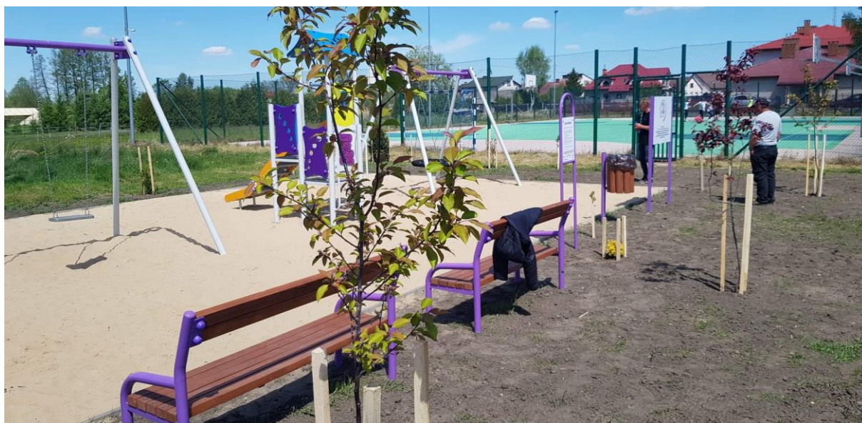
Plac zabaw w miejscowości Sucha