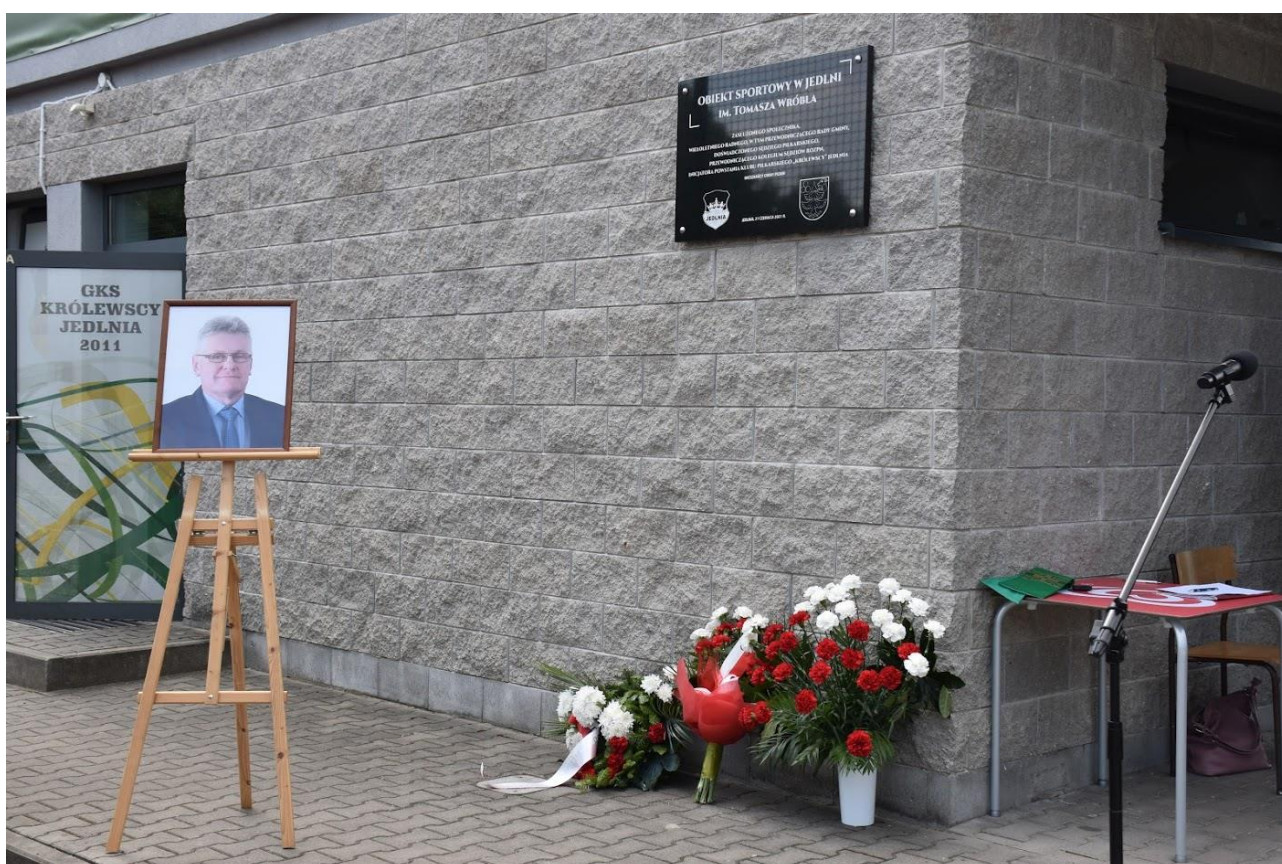
Odświeżenie tablicy pamiątkowej.