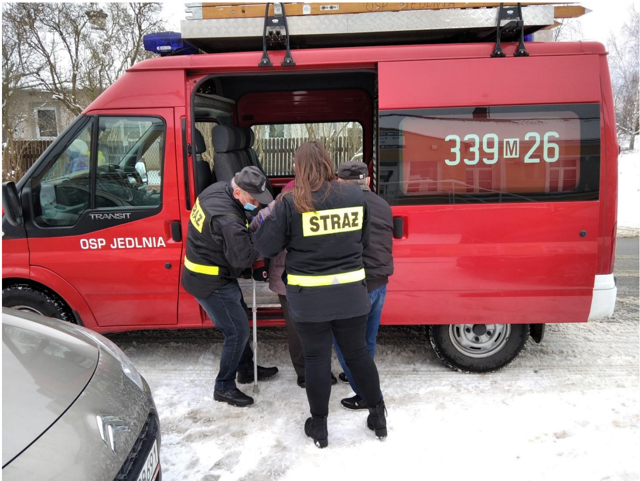
Bezpłatny transport mieszkańców Gminy Pionki do punku szczepień

Jednocześnie, w związku z potrzebą podniesienia poziomu świadomości i wiedzy mieszkańców gminy na temat profilaktyki chorób zakaźnych, w tym w szczególności choroby COVID-19, podejmowane były przez pracowników Urzędu Gminy Pionki aktywne działania edukacyjno-popularyzacyjne, m.in. podczas imprez plenerowych odbywających się na terenie Gminy Pionki. Z uwagi na fakt, iż głównym zamierzeniem organizatorów było przekazywanie mieszkańcom rzetelnych informacji, działania te odbywały się przy współudziale osoby reprezentującej środowisko medyczne. Tym samym, uczestnicy wydarzeń mogli w przystępny sposób uzyskać wszystkie niezbędne informacje dotyczące szczepień przeciw COVID-19 – zarówno te teoretyczne, jak i praktyczne. Na uczestników czekały specjalnie przygotowane gadżety, promujące szczepienia przeciwko COVID-19 w postaci dedykowanych: smyczy, długopisów, opasek silikonowych, balonów czy ulotek informacyjnych.