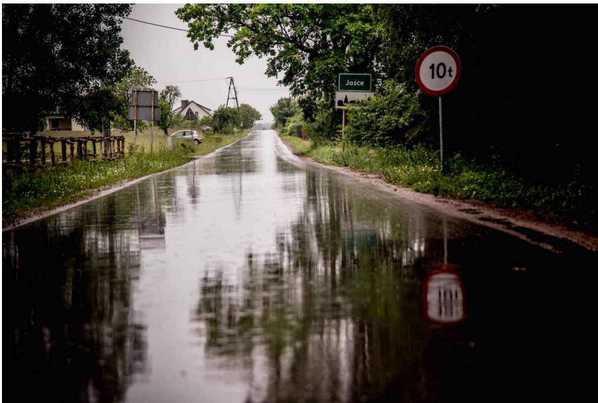
Droga gminna w miejscowości Jaśce

W zakresie transportu i łączności wykonano przebudowę drogi gminnej w miejscowości Jaśce o długości 1570 m. Wartość zadania wyniosła 560 934,19 zł. Przebudowa drogi finansowana była ze środków własnych Gminy Pionki.