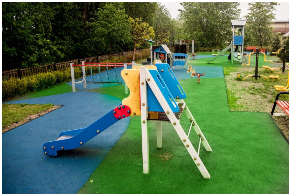
Plac zabaw w miejscowości Jedlnia.

za kwotę 71.679,49 zł. Zakup i montaż urządzeń wyposażenia placu zabaw finansowano z Funduszu Soleckiego poszczególnych miejscowości oraz budżet województwa mazowieckiego w ramach Mazowieckiego Instrumentu Aktywizacji Sołectw MAZOWIA 2021. Na placu zabaw w miejscowości Mireń wykonano i zamontowano altanę ogrodową. Ponadto wykonano ogrodzenie placu zabaw w miejscowości Januszno i Czarna Kolonia.