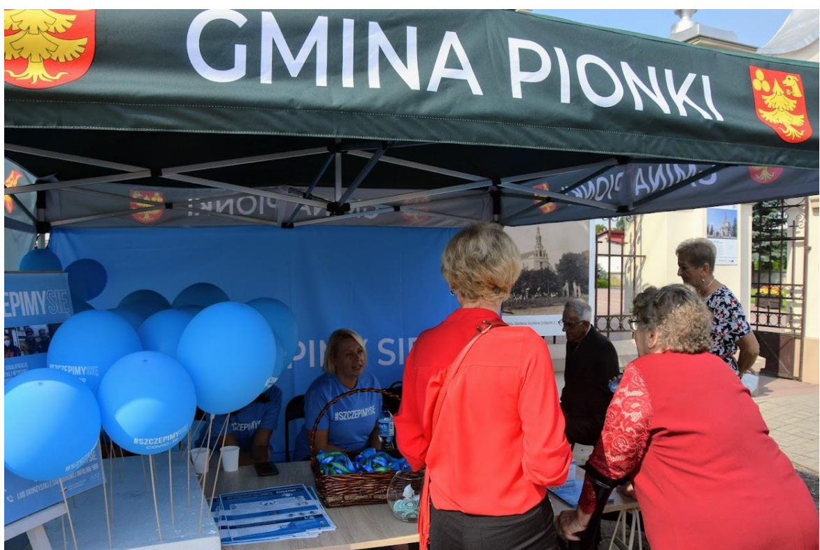
Akcja informacyjno - promocyjna dot. szczepień przeciwko Covid 19.