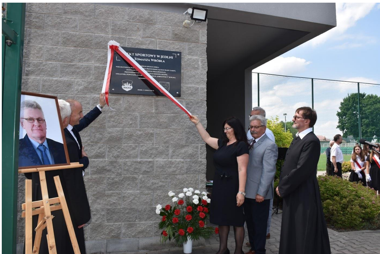
Odsłonięcie tablicy pamiątkowej.