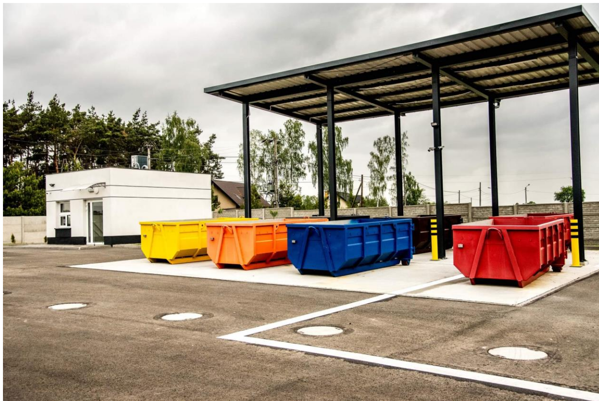
Punkt Selektywnej Zbiórki Odpadów Komunalnych w Jedlni

W ramach gospodarki komunalnej i ochrony środowiska zakończono budowę PSZOK na terenie oczyszczalni ścieków w miejscowości Jedlnia. Na realizację tego zadania w 2021 roku wydatkowano z budżetu Gminy Pionki kwotę 669.590,00 zł.