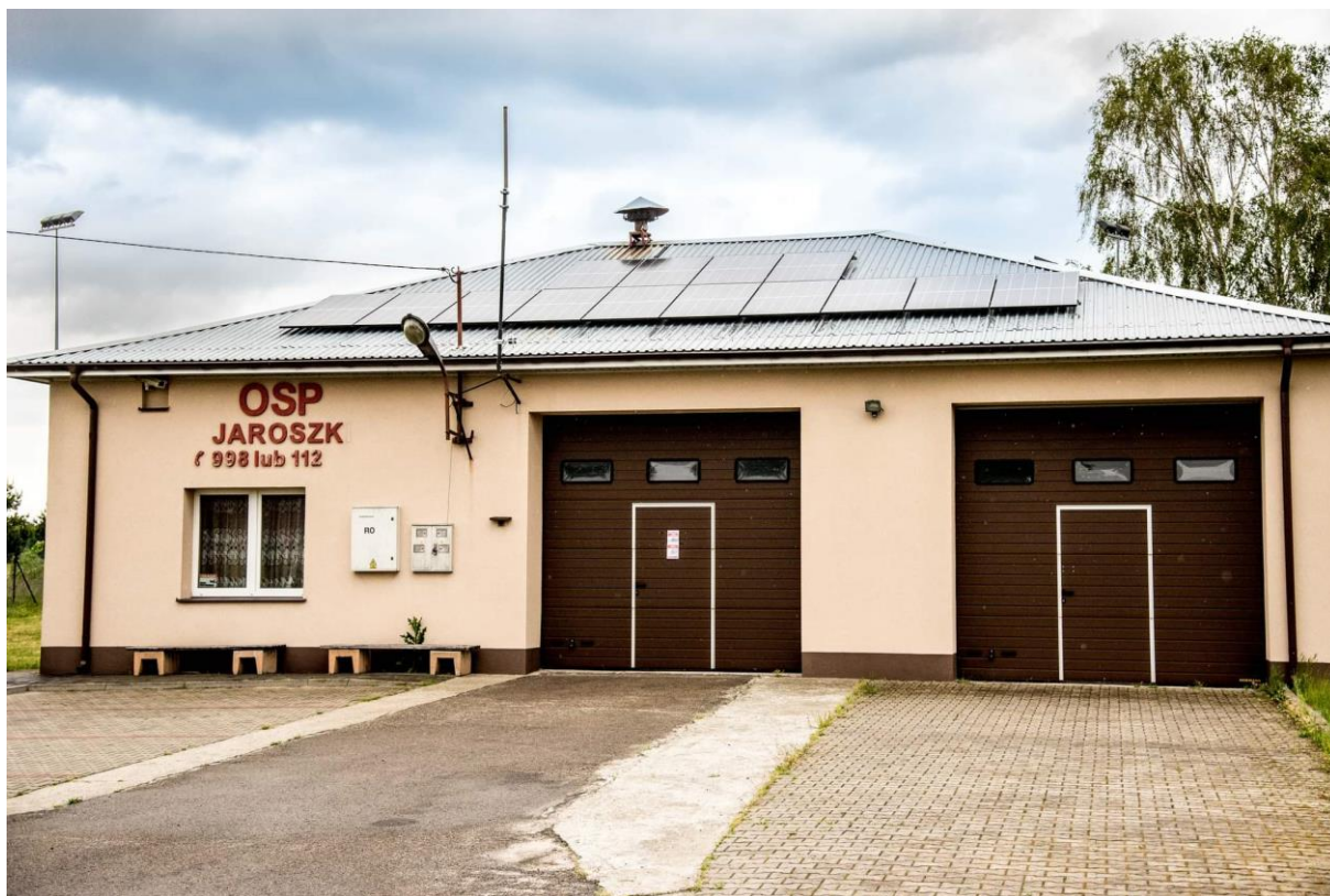
Instalacja fotowoltaiczna na budynku OPS Jaroszki

W ramach bezpieczeństwa publicznego i ochrony przeciwpożarowej wykonano instalację fotowoltaiczną na budynku OSP w Jaroszkach w ramach Funduszu Sołeckiego wsi Brzezinki i Jaroszki. Wartość instalacji fotowoltaicznej to kwota 47.997,06 zł.